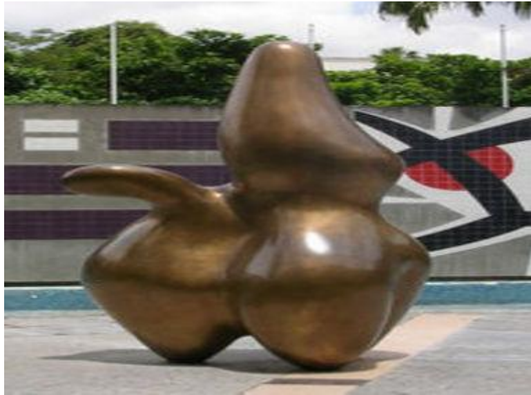
OBLIK KOJI ULAZI U PROSTOR