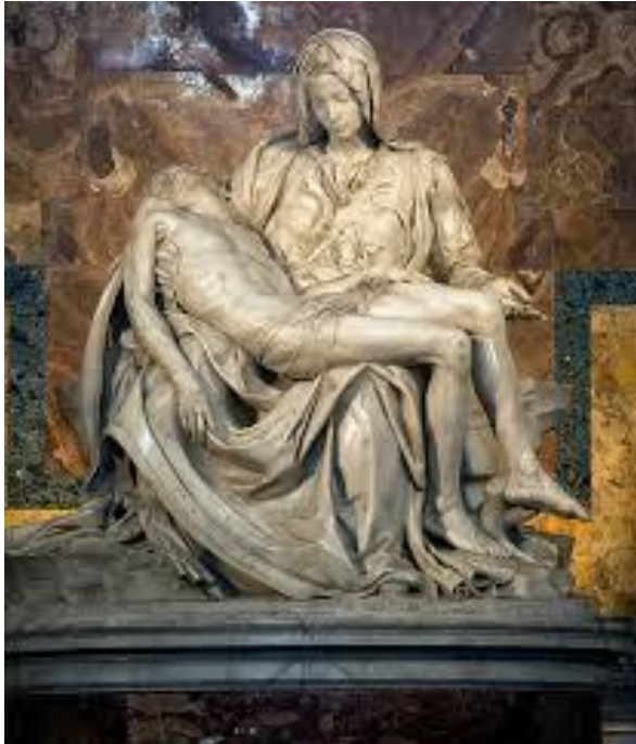
Michelangelo : Pieta – 3d skulptura